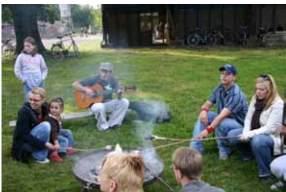
Am Feuer bei Stockbrot und Musik

Ein sehr schönes Ereignis in der noch kurzen Geschichte des Projekts Königsmühle war das Hoffest im September 08.