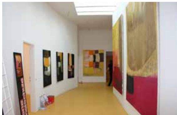
Bilder von H. Raven in der improvisierten Galerie im Südflügel