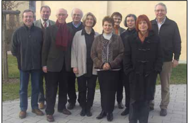
Der Vorstand der BEV:

Die BEV ist Mitherausgeberin der Zeitschrift PUNKT UND