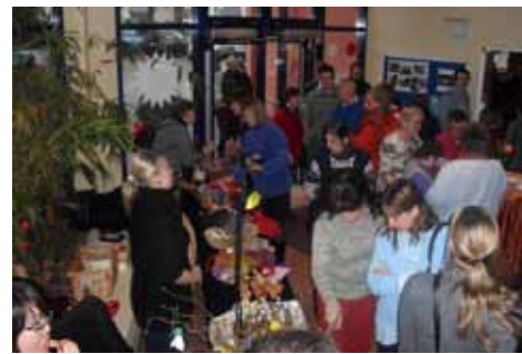
Neujahrskonzert - auch ein Ort der Begegnung