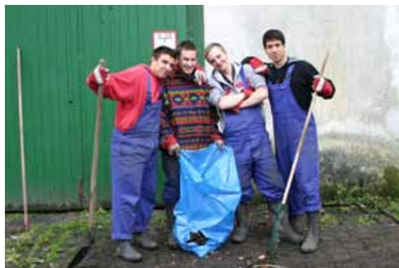
Die Helfer aus der Projektwerkstatt

Zunächst ging es aber nicht um solche Visionen, sondern um ganz viel Dreck, den ein widerrechtlich in die Gebäude eingedrungener Zirkus hinterlassen hatte. Schüler des Rudolf-Steiner Berufskollegs haben in dieser Zeit viel dazu beigetragen, dass allmählich Ordnung und Leben auf das noch sehr einsame Gut kamen. Unmengen von Müll und Gerümpel mussten entsorgt werden, vor dem heutigen Café lagerte ein riesiger stinkender Misthaufen, Zäune waren zu reparieren und Wege