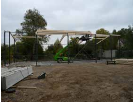
Während der Bauphase