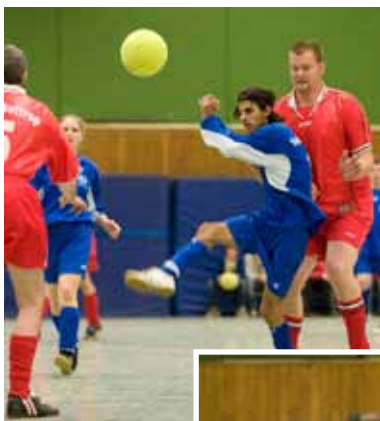
Spielszenen aus dem Turnier