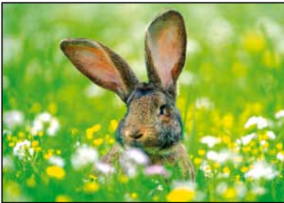
Der Osterhase als Symbol für Fruchtbarkeit und den nahenden Frühling

So begrüßen sich die Menschen im alten Russland in der Osternacht. Diese freudige Überzeugung gab ihnen Kraft, ihr oft armseliges Leben in Frömmigkeit und aufrechter Gesinnung durchzutragen.