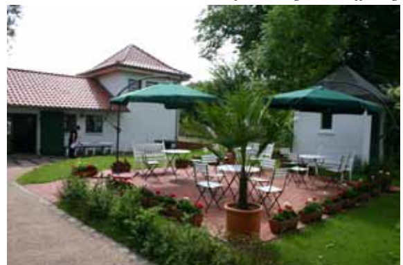
Das Café am Tag der Eröffnung