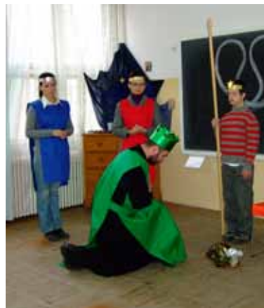
Eindrücke aus der Probenarbeit

Überwürfe für die Proben fertig waren, trat eine ganz andere andachtsvolle Stimmung unter den Spielenden ein. Es wurde wichtig, wie die Gestik, Mimik, das Sprechen und das Laufen - vor allem aber die Anbetung