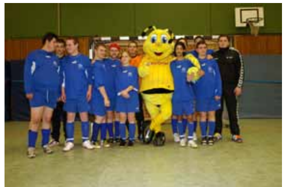
Die Fußballmannschaft der Werkstätten Gottessegen zusammen mit dem BVB-Maskottchen Emma.

... war es dann endlich soweit. Alle Vorbereitungen waren getroffen, die Tageszeitungen in Dortmund hatten im Vorfeld über dieses Turnier berichtet und plötzlich kam eine Anfrage der Lokalredaktion des WDR auf die Organisatoren zu. Also wurde das abschließende Treffen in den Werkstätten Gottessegen kurzfristig für die Filmaufnahmen genutzt. Darüber hinaus drehte der WDR noch Szenen in der Holzwerkstatt und auf dem Gelände der Werkstätten. Die abschließenden Vorbereitungen in der Sporthalle und natürlich der Ablauf des Turniers am folgenden Tag wurden ebenfalls mit der Kamera verfolgt, so dass in der Lokalzeit am 8. November ein ausführlicher Bericht über die-