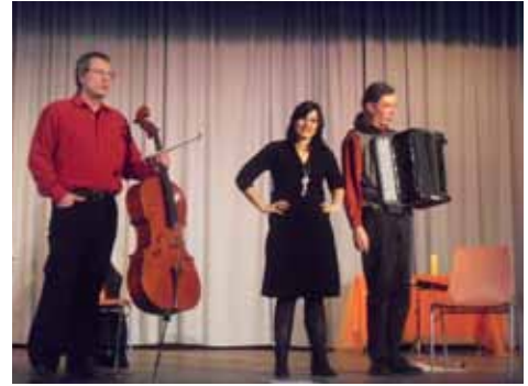
Das Trio DRAj

Mutter einer Schülerin in der 12. Klasse