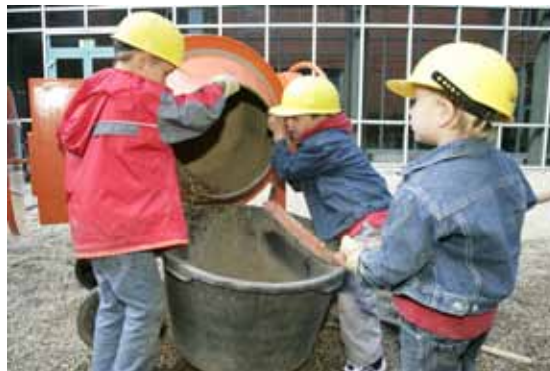
Kinderbaustelle auf der DASA: Mitmachen ist hier ausdrücklich erwünscht!

In dem Ausstellungsbereich „Mehr Sicherheit am Bau“ wurden verschiedene Baumaschinen wie Bagger, Radlader usw. gezeigt. Man konnte einen richtigen Bagger mal selber ausprobieren.